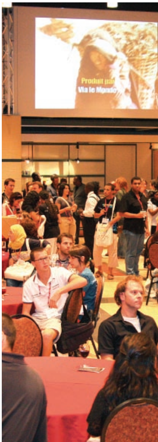
5 à 7 du Comité jeunesse, Congrès mondial des jeunes (CMJ), août 2008