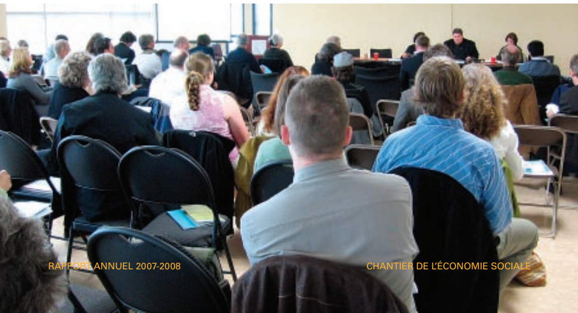
Assemblée générale annuelle du Chantier, Outaouais, octobre 2007

Des représentants du Chantier siègent au sein des Conseils d'administration du Réseau d'investissement solidaire du Québec (RISQ) et du Comité sectoriel de main-d'œuvre de l'économie sociale et de l'action communautaire (CSMO-ÉSAC) ainsi qu'au Conseil des fiduciaires de la Fiducie du Chantier de l'économie sociale. ■